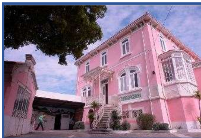
Fig.1 – Palacete a requalificar

Esta Campanha prevê que os Azulejos Solidários comercializados, após respetiva identificação, sejam colocados nos muros circundantes do Palacete da instituição, de forma a embelezá-los, mas, fundamentalmente, a possibilitar o apoio à requalificação do exterior e interior do Palacete, aliando a manutenção da produção e atividade da Oficina do Azulejo do CEERIA, pelos clientes da instituição.